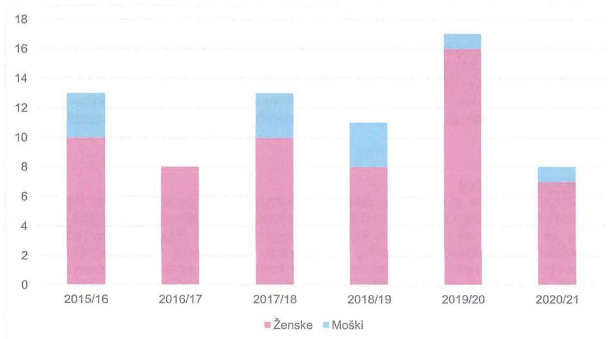
Graf: Struktura vpisanih študentov po spolu